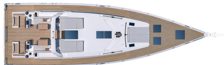
Version 3 cabines 2 salles d'eau :